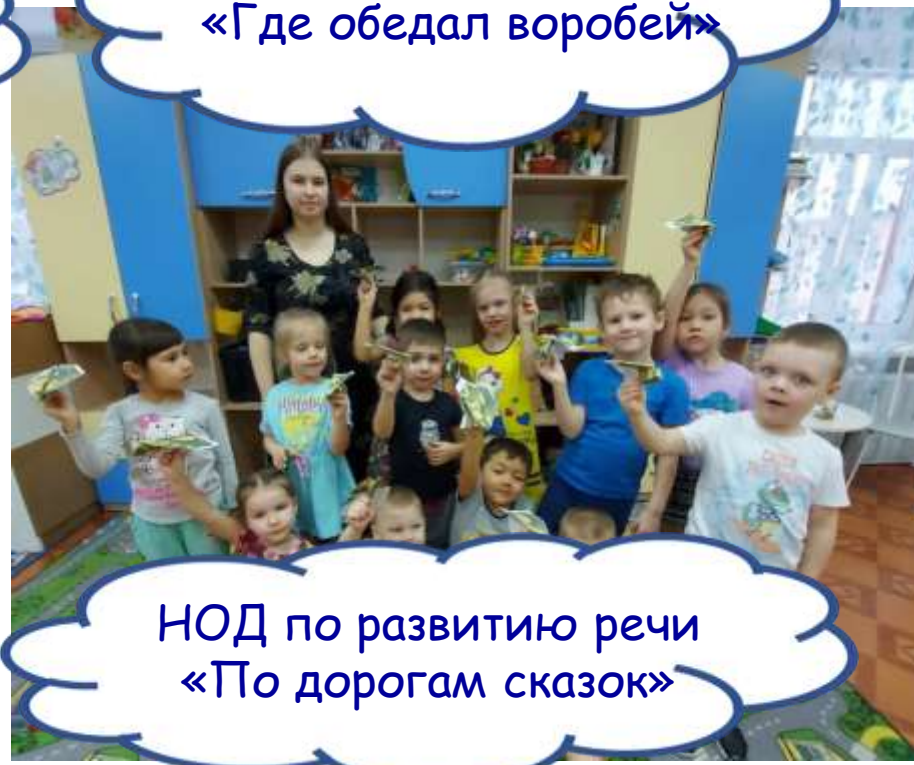
НОД по развитию речи «По дорогам сказок»