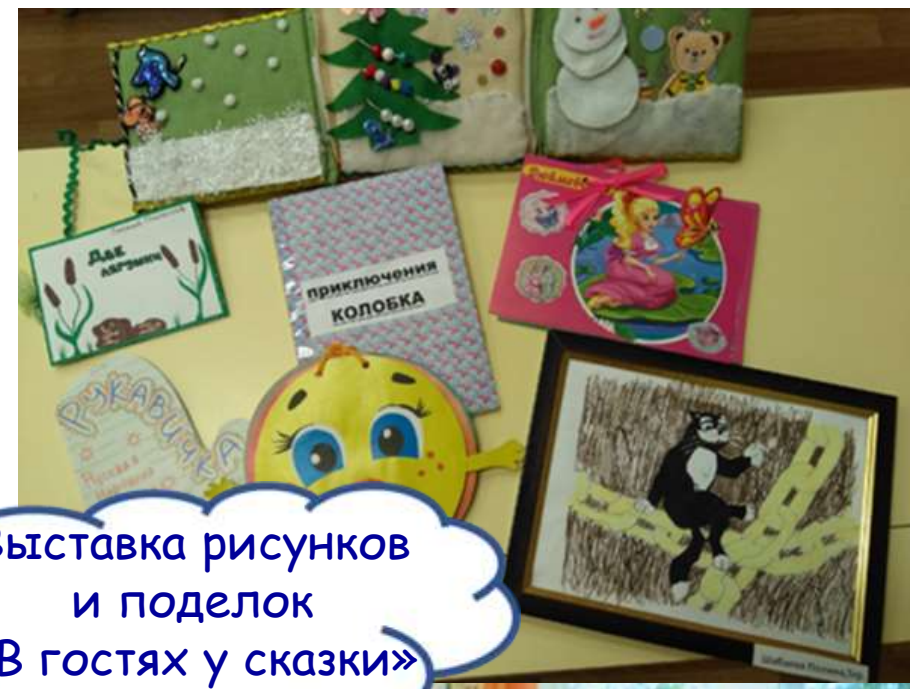
Выставка рисунков и поделок «В гостях у сказки»