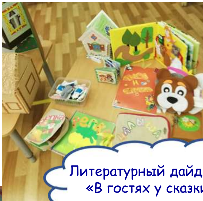
Литературный дайджест «В гостях у сказки»