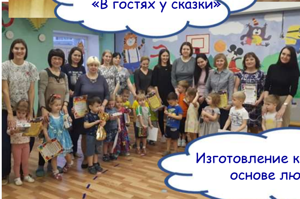
Изготовление книжек-малышек на основе любимых сказок