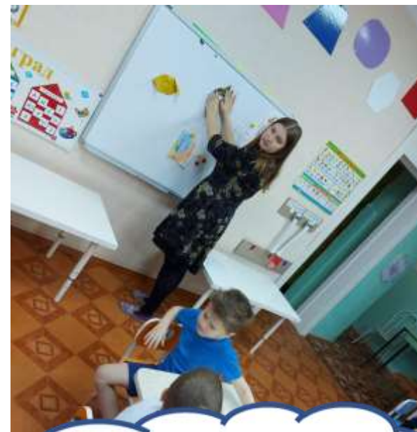
Инсценировка сказки «Заюшкина избушка»