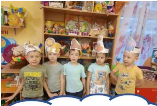
Инсценировка сказки «Где обедал воробей»